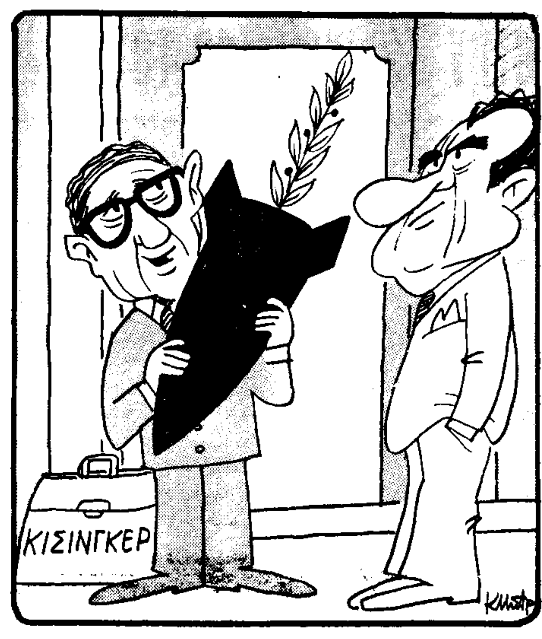
Λέω να δομηθώμε το 'Ανοί με προτάσεις ειρήνης. Ο κεί;